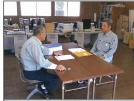
営業部長による雇入れ時教育