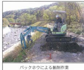
バックホウによる掘削作業