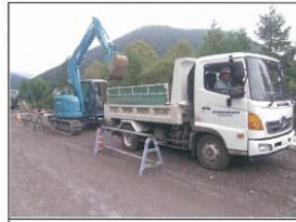
4tダンプトラックによる土砂運搬