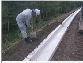
道路路肩埋戻し作業